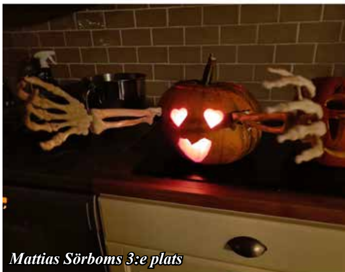
Mattias Sörboms 3:e plats