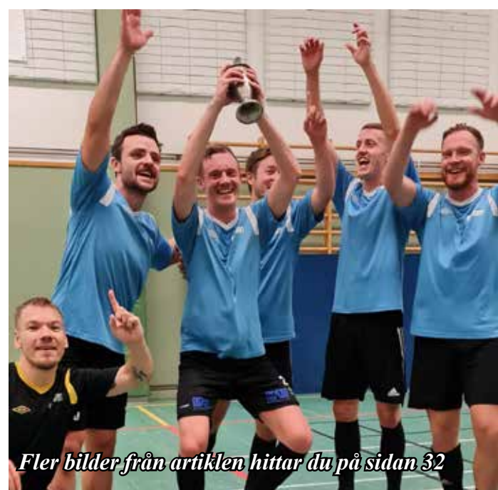
Fler bilder från artiklen hittar du på sidan 32