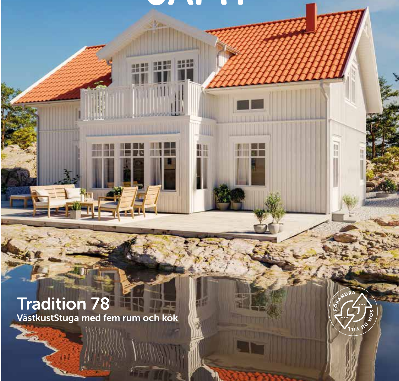
Tradition 78 Väst kustStuga med fem rum och kök