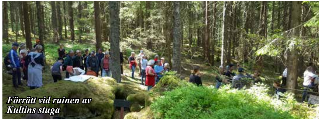
Förrätt vid ruinen av Kultins stuga