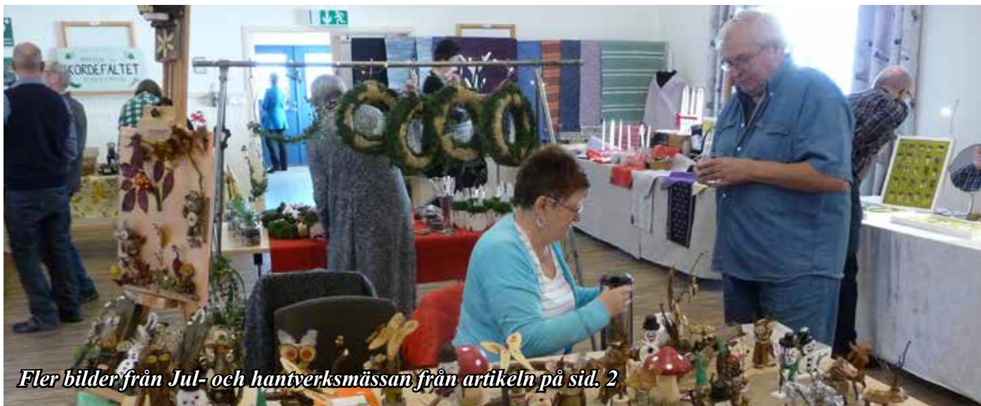
Fler bilder från Jul- och hantverksmässan från artikeln på sid. 2